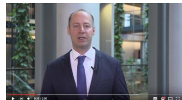
Videobotschaft aus dem Europäischen Parlament ( https://youtu.be/BTPGWZ4CeLU )