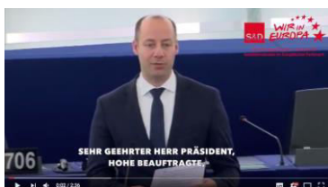
Video zur Rede „Verfolgung von Christen im Nahen Osten“ ( https://youtu.be/o11jcZOMII )