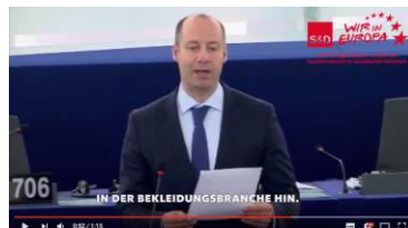
Video zur Rede „Umsetzung Nachhaltigkeitspakt Bangladesch“ ( https://youtu.be/9By9Zj68Qto )