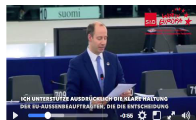
Video – Plenarrrede: Ankündigung Trump Jerusalem ( https://youtu.be/UtaV361iaHM )