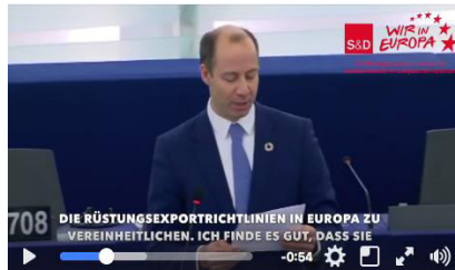
Video – Plenarrrede: PESCO – Neues Kapitel Sicherheitspolitik ( https://youtu.be/hWcGz8Qkbnk )