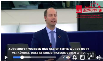
Video – Plenarrrede: Agenda 2030 ( https://youtu.be/opXTEB5c-Cg )

Mitte Dezember fand die letzte Plenartagung des Jahres 2017 statt. Neben den UN-Nachhaltigkeitszielen 2030 und der Neuausrichtung der EU-Verteidigungspolitik (PESCO), hielt ich eine Rede zur Ankündigung Trumps Jerusalem als Hauptstadt Israels anzuerkennen. Schaut Euch die Videos zu den Reden an: