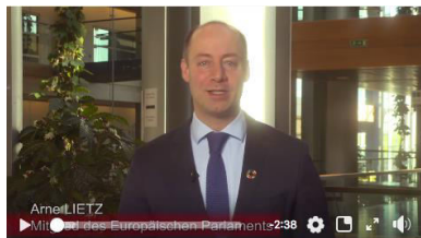
Video – Videobotschaft aus dem Europäischen Parlament https://youtu.be/nXvT5stC5F4