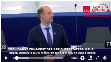
Video – Plenumsrede: EU-Finanzinstrumente der Außenbeziehungen https://youtu.be/-S9WoDx1prQ

Im Plenum hielt ich zwei Reden, bei denen ich zum einen die Lage in Korea thematisierte und bemerkte, dass langfristig das Iran-Nuklearabkommen als Referenzwerk für einen möglichen Deal mit Nordkorea dienen muss. Auch deshalb muss Trump unbedingt Abstand von seinem Vorhaben nehmen, das Iran-Abkommen einseitig aufzukündigen. Zum anderen sprach ich über das Instrument für Stabilität und Frieden, EU-Instrument zur Unterstützung von Sicherheitsmaßnahmen und friedensbildenden Tätigkeiten in Partnerländern bei dem es auch zukünftig nicht sein darf, dass Mittel der Entwicklungszusammenarbeit für Militär in Drittländern eingesetzt wird.