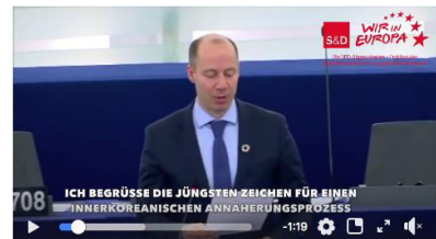
Video – Plenumsrede: Friedensaussichten Korea https://youtu.be/5BICStYozSg