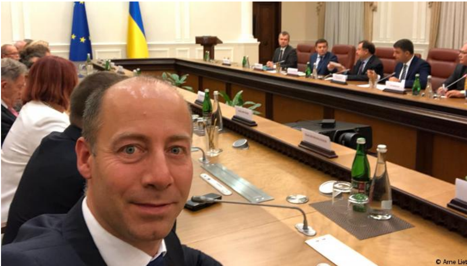
Арне Ліц на зустрічі з українськими урядовцями

Група євродепутатів відвідали Україну, зокрема Донбас. Соціал-демократ Арне Ліц розповів DW, як ЄС має реагувати на дії Росії в Азовському морі та як він переконує своїх виборців у необхідності санкцій щодо РФ.